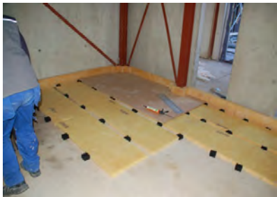
Kulturhus in Nieuwkoop