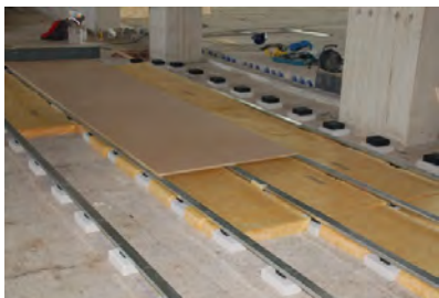
Bioscoop CineMeerse Hoofddorp