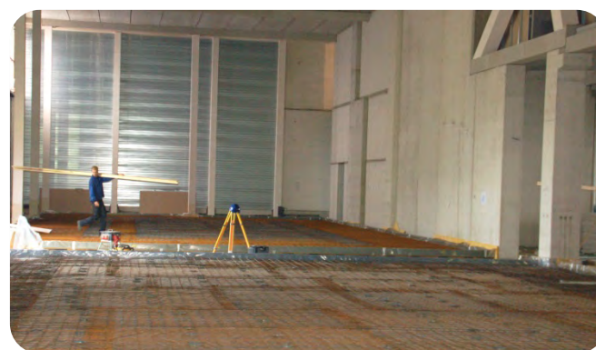
De zwevende vloer is gereed en de dekvloer kan worden gestort