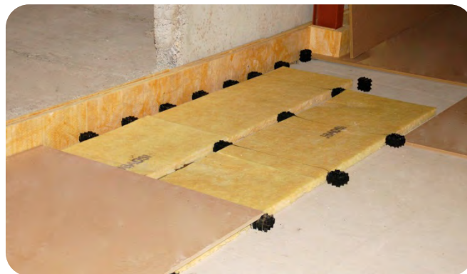
De opbouw van de zwevende vloerconstructie