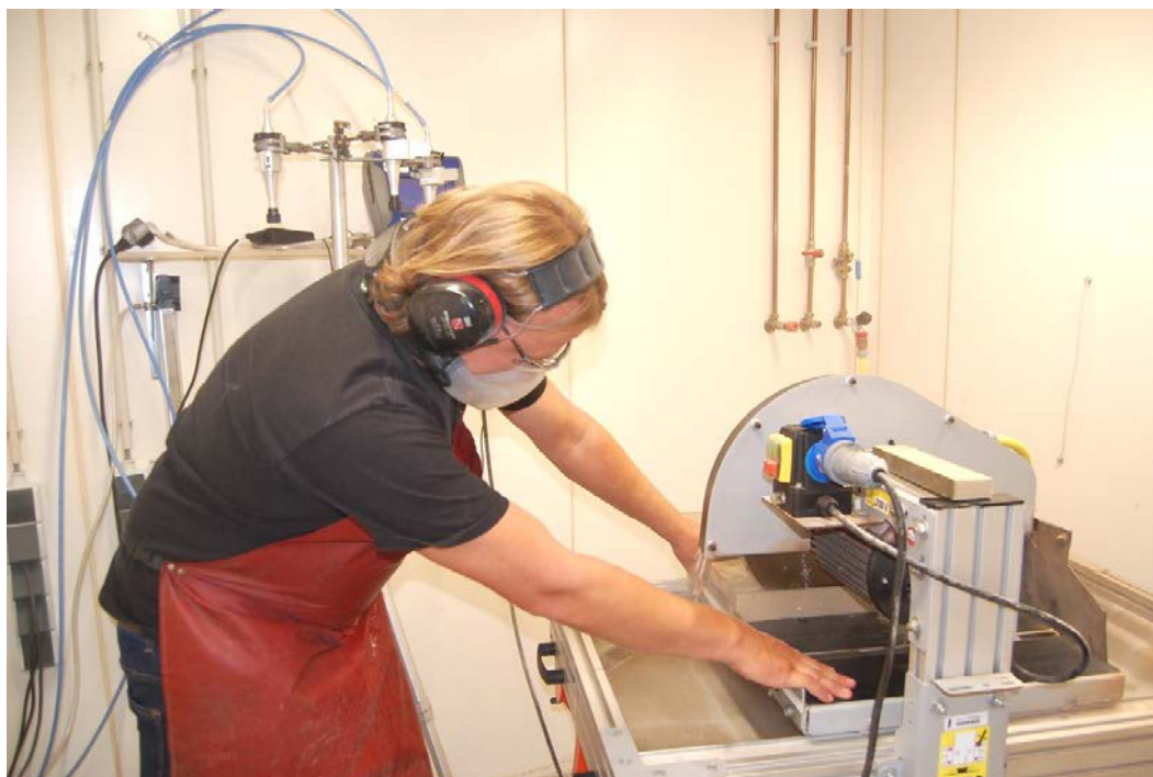
Onderzoek in de Worst Case Room van TNO

In onderstaande Tabel 4 worden de meest toegepaste bewerkingen en -technieken aan zandsteen vermeld. Naast het type bewerkingen zijn in deze Tabel 4 ook de overschrijdingsfactoren, zie ook [14] [15], vermeld voor deze bewerkingen ten opzichte van de huidige grenswaarde van respirabel kwarts ( 0,075 \text{ mg/m}^3 ). Er worden twee overschrijdingsfactoren vermeld. In de eerste kolom gebaseerd op het bewerken van kalkzandsteen (percentage kwarts 25%), in de tweede kolom gebaseerd op het bewerken van Bentheimer zandsteen (percentage kwarts 60% - 95%). Deze meetresultaten zijn verkregen in de Worst Case Room van TNO te Delft bij 100% inschakeltijd van de gereedschappen-productiemiddelen. Deze overschrijdingsfactor dient als input voor de keuze van effectieve beheersmaatregelen, met het doel de blootstelling aan respirabel kwarts in de ademzone van de werknemers te minimaliseren. In ieder geval moet worden voldaan aan de wettelijke grenswaarde van respirabel kwarts (GSW TGG-8 uur: 0,075 \text{ mg/m}^3 ).