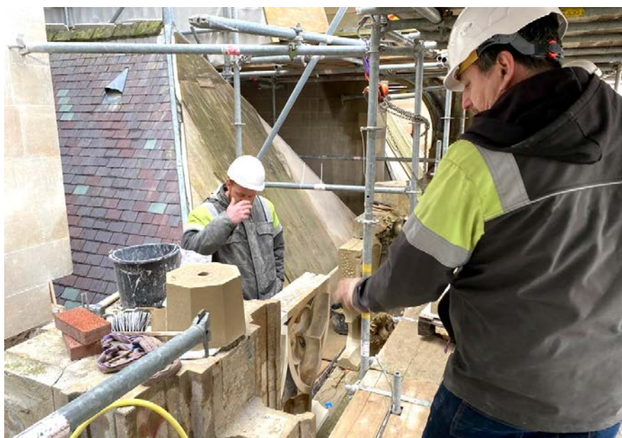
Restauratie van de Sint Jan Kathedraal

In onderstaande Tabel 5 worden de meest toegepaste bewerkingen-technieken aan zandsteen vermeld. Naast het type bewerkingen zijn in deze Tabel 5 ook de overschrijdingsfactoren vermeld voor deze bewerkingen ten opzichte van de huidige grenswaarde van respirabel kwarts ( 0.075 \text{ mg/m}^3 ). Er worden twee overschrijdingsfactoren genoemd. In de eerste kolom gebaseerd op het bewerken van kalkzandsteen (percentage kwarts 25% (kunststeen)), in de tweede kolom gebaseerd op het bewerken van Bentheimer zandsteen (percentage kwarts 60% tot meer dan 95%). Deze meetresultaten zijn verkregen in de Worst Case Room van TNO te Delft bij 100% inschakeltijd van de gereedschappen-productiemiddelen. Deze overschrijdingsfactor dienen als input voor de keuze van effectieve beheersmaatregelen, met het doel de blootstelling aan respirabel kwarts in de ademzone van de werknemers te minimaliseren. In ieder geval moet worden voldaan aan de wettelijke grenswaarde van respirabel kwarts (GSW TGG-8 uur: 0,075 \text{ mg/m}^3 ).