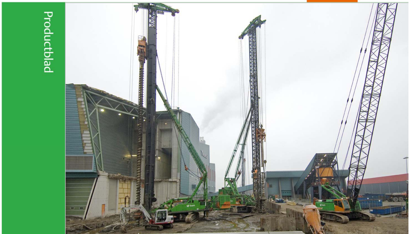
Derde verbrandingslijn afvalenergiecentrale Twente, Hengelo

Een combischroefpaal is een in de grond gevormde schroefpaal waarbij de schacht is voorzien van een prefab element en waarbij de paalkop verdiept onder het maaiveld is geplaatst. Het paalsysteem is trillingsvrij en geluidsarm. De BAM Combischroefpaal is geotrooieerd.