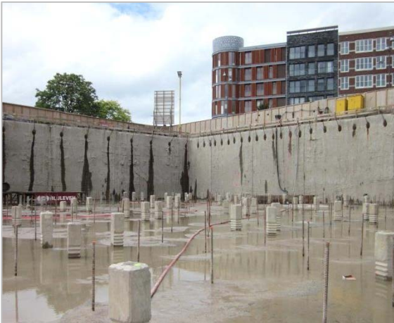
Bouwkuip Tricotage Veenendaal