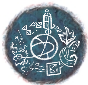
Witrot in hout