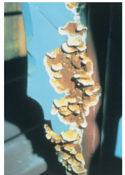
Huiszwam - vruchtlichaam (in consolevorm). Onder afsluitende verflagen kan de huiszwam al enigszins vochtig hout makkelijker aantasten