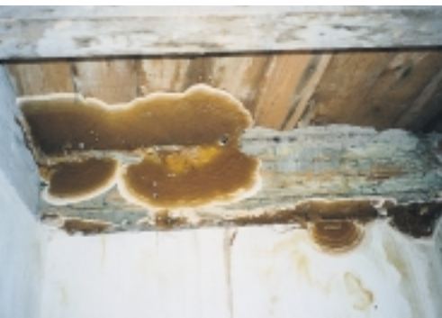
Huiszwam - vruchtlichamen (in plaatvorm). Vruchtlichamen van de huiszwam komen vaak voor op de overgang hout - muur (boven) of op de bodem in kruipruimten (onder)