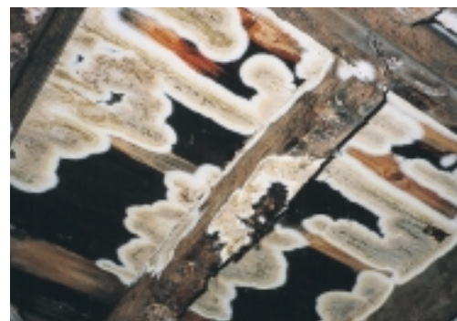
Kelderzwam - vruchtlichamen. Deze vruchtlichamen worden makkelijk verward met die van de huiszwam

De oorzaken van vochtinfiltratie en/of condensatie moeten we nauwkeurig en volledig lokaliseren en wegnemen. Daardoor stopt de watertoevoer, waardoor de schimmelgroei vertraagt. Wanneer het houtvochtgehalte nog verder daalt – naar ongeveer 22% – stopt de schimmelgroei. Maar om onnauwkeurigheden bij vochtmetingen uit te sluiten, gaan we in de praktijk uit van 20%. Om de groei in korte tijd te stoppen moeten constructies zo snel mogelijk drogen. Dit vereist vaak langdurige ventilatie, soms is ventilatie overbodig. Ventilatie is overbodig om lokaal, licht vochtig hout te drogen. Bijvoorbeeld een kleine lekkage. Dan volstaat het verhelpen van de vocht oorzaak. Daarentegen is ventilatie onvoldoende bij constructies van zware afmetingen en bouwdelen met een wijdverspreide of zware vochtbelasting. Dan moeten we