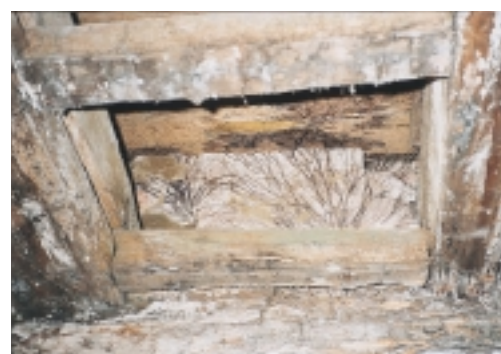
Kelderzwam - strengen