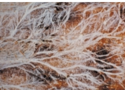
Poriënzham - strengen

Huiszwam in kruipruimten Sporen op de kruipruimte-bodem ontwikkelen zich alleen tot nieuwe aantastingen als daarop of daarin afval voorkomt. Het gaat om resten hout, papier, karton en hardboard. Als deze resten achterblijven, gaat een bespuiting van de bodem niet tegen dat de huiszwam zich verder verspreidt.