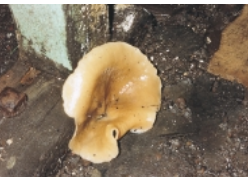
Bekerzwam - vruchtlichaam. Een van de schimmels die wijzen op veel vocht, maar die hout niet aantasten

voortplantingscellen). Deze kenmerken van schimmels staan in de tabellen 1 en 2. Helaas lijken veel schimmelsoorten op elkaar. Een betrouwbare bepaling van de soort vereist dan ook kennis en ervaring. Verder is vergissing mogelijk met andere verschijnselen. Op muren gaat het om uitbloeiende minerale zouten. En bij hout in kappen, klokkenstoelen en onder loodbekledingen is vergissing mogelijk met een geheel andere aantasting: vervilting.