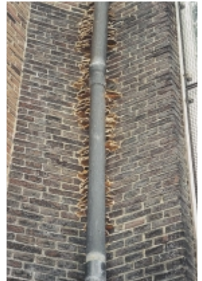
Huiszwam - vruchtlichaam (in consolevorm). De huiszwam vormt vaak vruchtlichamen op muren, maar zelden aan de gevelzijde

Bestrijdingsmiddelen werken alleen als aanvulling op het opheffen van de vochtoorzaken en het bevorderen van de droging: waar een snelle droging niet mogelijk is, geven bestrijdingsmiddelen een snelwerkende, maar tijdelijke bescherming. Met bestrijdingsmiddelen kunnen we een traag droogproces overbruggen. Alleen op bepaalde plaatsen verloopt de droging traag. Vaak gaat het om hout tegen of in vochtige muren. Op plaatsen waar hout slecht droogt – en daar alleen – kunnen bestrijdingsmiddelen helpen, maar daarvoor moeten ze wel voldoende diep in het hout dringen.