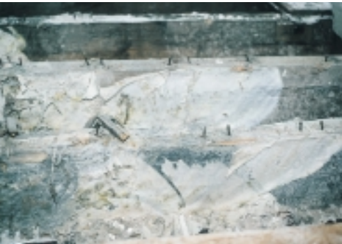
Huiszwam - schimmelweefsel. Naast dit vliesachtige weefsel vormt de huiszwam ook wattenachtig weefsel

verder gaan door de ventilatie te verbeteren en/of de ruimte te verwarmen. We verbeteren de ventilatie door bouwdeelen tijdelijk 'te openen': het wegnemen van vloerplanken (altijd aan twee tegenover elkaar liggende zijden van de vloer), het afnemen van betimmeringen, het blootleggen van lateien, en het verwijderen van aftimmeringen tegen dakvlakken. We kunnen de droging ook versnellen door de ruimte te verwarmen met de bestaande verwarmingsinstallatie. Ga daarbij condensatie tegen door tegelijkertijd goed te ventileren.