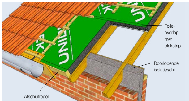
Unidek Reno Sporen op bestaande sporenkap

gens worden de dakelementen in verband gebracht waarbij deze eenvoudig tegen de reeds geplaatste dakelementen geschoven worden. Hierbij is geen kliksysteem of andere tijdrovende schakelmethode noodzakelijk. De plakstrip aan de onderzijde van de folie-overlap wordt op ondergelegen dakelementen vastgeplakt. Met behulp van een schroefmachine worden de dakelementen door middel van zelfborende schroeven door de tengels heen in de sporen vastgezet. De folie zorgt voor een uitstekende waterdichtheid en kan daarnaast eenvoudig over de afschuifregel worden geplakt waardoor lekwater verantwoord kan worden afgevoerd. Aansluitingen op omringende constructies worden water- en luchtdicht afgewerkt met Unidek Montageschuim.