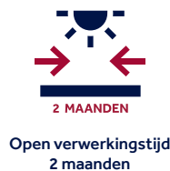
Open verwerkingstijd 2 maanden