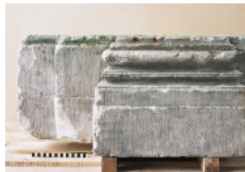
Dit Ionische basement met dubbele astragaal, een smal, ringvormig profiel, is een van de weinige fragmenten van de voorgevel van het Huis Huydecoper te Amsterdam dat gered kon worden door het in de collectie van de Rijksdienst voor de Monumentenzorg op te nemen