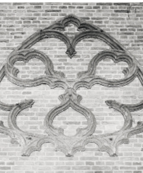
Een van de drie bewaard gebleven negentiende-eeuwse gietijzeren traceringen van de Sint-Martinuskerk te Doesburg is opgehangen in de toren. Tijdens de restauratie tussen 1959 en 1969 werden deze unieke traceringen vervangen door natuurstenen versies (foto 1993)