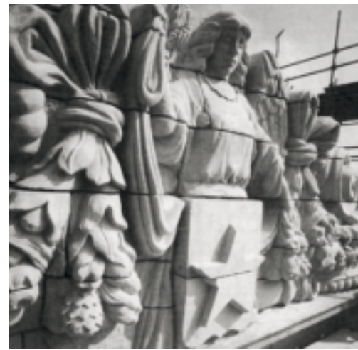
Het nieuwe fronton van het stadhuis van Maastricht van beeldhouwerij Ton Mooy tijdens de opbouw in 1996

Het streven van landeigenaren om hun kasteel een belangrijker historisch aanzien te geven, of om de anciënniteit tot uiting te laten komen door bouwfragmenten van een gesloopte voorganger weer te gebruiken, stond niet op zichzelf. Het was een wijd verbreid gebruik.