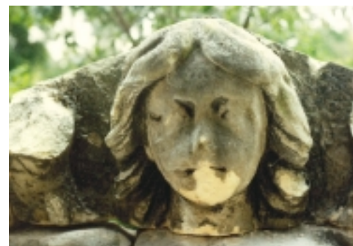
De stedenmaagd van Maastricht voor en na 1996