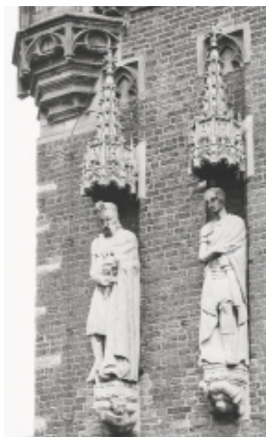
In 1949 zijn er nieuwe beelden van J. Poet op het raadhuis van Kampen geplaatst (foto 1949)