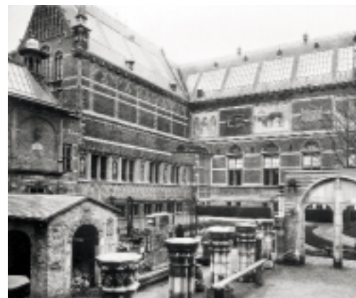
Bouwfragmenten in de tuin van het Rijksmuseum te Amsterdam (1877-1885). Situatie voor de tweede Drucker-uitbouw van na 1914