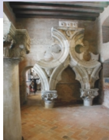
Dit originele bouwsculptuur van het Dogenpaleis te Venetië staat permanent tentoongesteld op de begane grond

Er was overigens ook kritiek. Sommigen pleitten al sinds de negentiende eeuw vanuit het