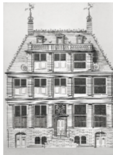
De gevel van het zeventiende-eeuwse Huis Huydecoper te Amsterdam is gedemonteerd na oorlogsschade in 1943 (tekening uit 'Afbeeldsels der voornaamste gebouwen nyst alle die Philips Vingboons geordineert heeft', Amsterdam, 1648)

Naast architectuurfragmenten en bouwbeeldhouwwerk bevat de studieverzameling ook een collectie historische bouwmaterialen en negentiende-eeuwse industriële producten. Het ontstaan ervan is ten nauwste verbonden met de geschiedenis van de Rijksdienst en de Nederlandse monumentenzorg. Al sinds de jaren dertig van de vorige eeuw en vooral sinds de aanstelling van bouwhistorici begin jaren zestig, streeft de Rijksdienst actief naar een overzicht van met name historische bouwmaterialen. Vanaf 1980 worden er ook grotere hoeveelheden bouwbeeldhouwwerk in de collectie opgenomen.