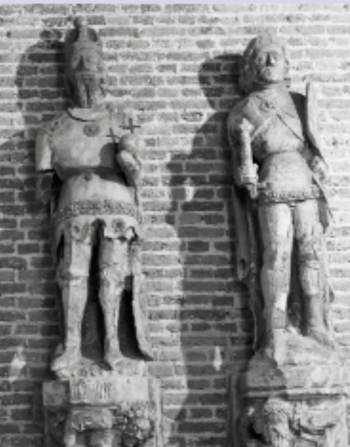
De oorspronkelijke beelden van het veertiende-eeuwse raadhuis van Kampen vormen een uniek onderdeel van de IJsselgotiek en staan nu opgesteld in de Koornmarktspoort in Kampen. Van de baldakijnen zijn geen fragmenten bewaard gebleven (foto 1984)