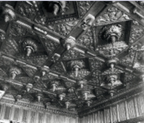
De huidige verblijfplaats van dit plafond in het negentiende-eeuwse Engelse kasteel Goodrich Court te Herefordshire is onbekend. Het is oorspronkelijk afkomstig uit een omstreeks 1540 gebouw stadspaleisje in Breda