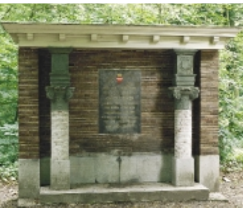
Het nieuwe monument voor Kasteel Buren uit 1972 bevat nog slechts enkele bouwfragmenten (foto 2006)