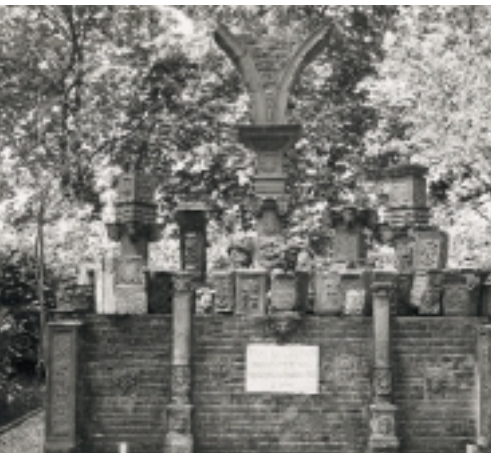
Bouwfragmenten van het in 1810 gesloopte Kasteel Buren zijn in 1899 toegepast in een monument (foto 1938)