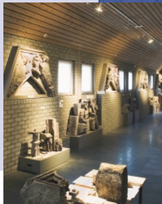
Museum De Bouwloods is het 'musée lapidaire' van de Sint-Janskathedraal te 's-Hertogenbosch, en een geslaagd voorbeeld van behoud en bescherming van bouwfragmenten in de buurt van het oorspronkelijke monument (foto 2006)

Daarnaast geldt diezelfde zorg ook voor belangrijke restanten van gesloopte gebouwen of gebouwen die door calamiteiten zoals oorlogen zijn vernietigd en waarvan inmiddels de architectuurhistorische waarde onbetwist is.