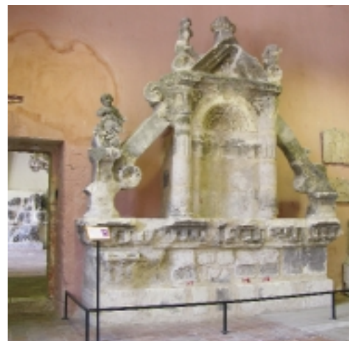
Op de ondervloer van Kasteel Blois staat de originele bouwsculptuur permanent tentoongesteld