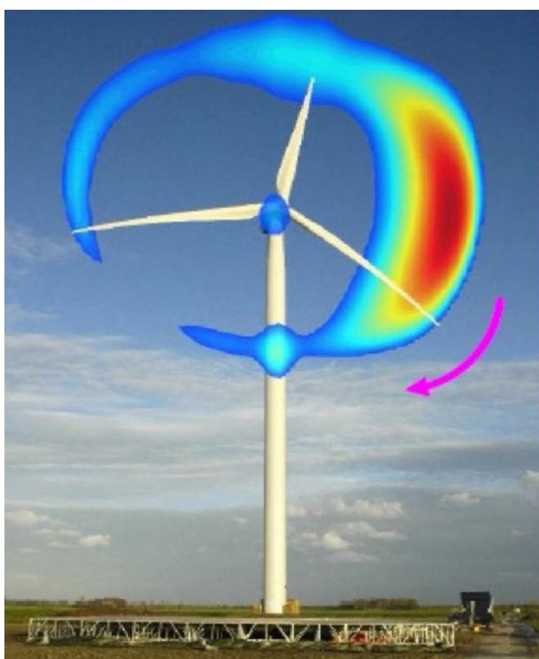
Figuur 1 – De productie van geluid door de draaiende bladen in kleur: hoe roder hoe luider.