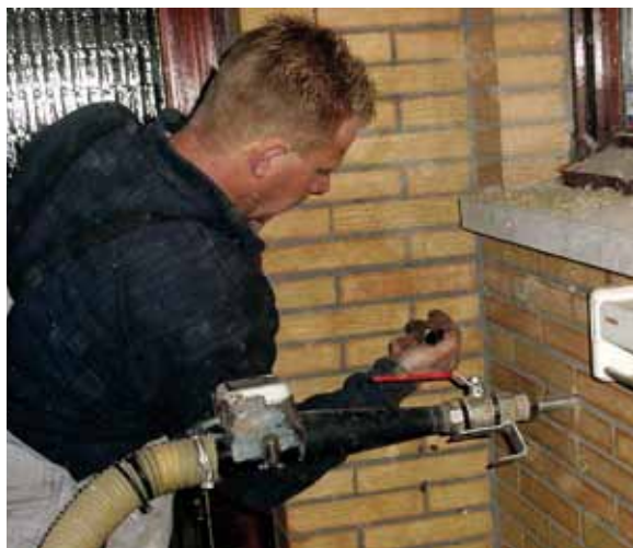
HET INBLAZEN VAN GLASWOL ALS SPOUWVULLING.

Bij de vlokvormige isolatiematerialen onderscheiden we rots- en glaswolvlokken: silicatische vezels die met behulp van siliconen wateraf-