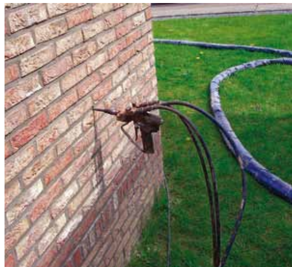
PUR-SCHUIM WORDT IN DE SPOUW GESPOTEN.

De grondstoffen voor UF-schuim zijn ureumformaldehydharz en water. Door de vermenging met lucht ontstaat er schuim, dat na toevoeging van een harder (fosforzuur) geïnjecteerd wordt in de spouw,